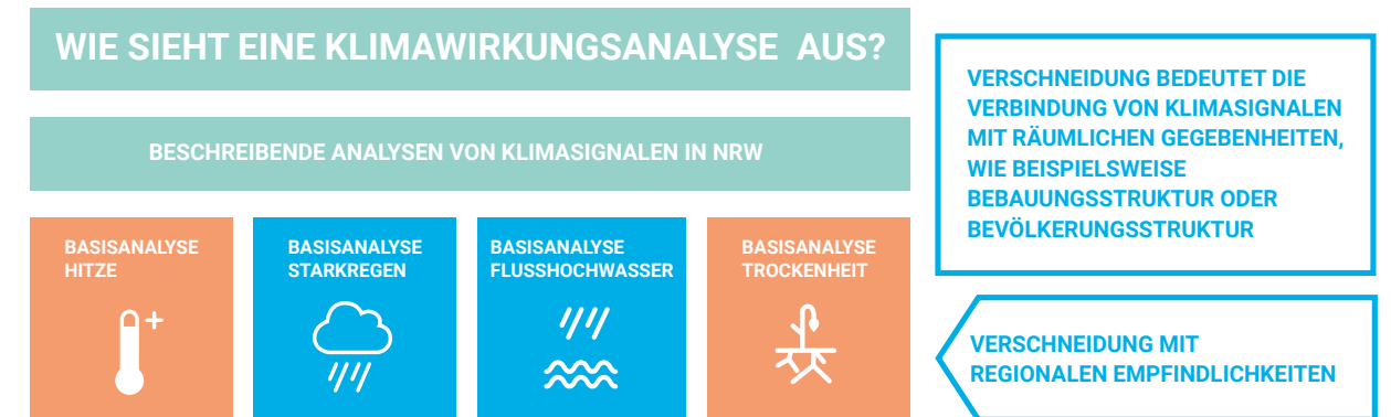
Abbildung 3: Klimawirkungsanalyse in Evolving Regions

den Regionen zu identifizieren. Mit Hilfe dieser Grundlage werden die Folgen des Klimawandels für die Beteiligten sicht- und greifbarer. Die Visualisierung möglicher regionaler Folgen der Veränderung des Klimas zeigt nicht nur örtliche Verwundbarkeiten, sondern sensibilisiert auch regionale Akteure, dass Maßnahmen zur Klimaanpassung nötig sind. Das Institut für Raumplanung der TU Dortmund bereitet die Klimawirkungsanalyse in Form von Karten auf und verschneidet die Wirkung mit räumlichen Charakteristika, wie beispielsweise der regionalen Gebäudesubstanz mit der Klimawirkung, sodass regionale Hotspots und Gefahrenstellen direkt ablesbar sind.